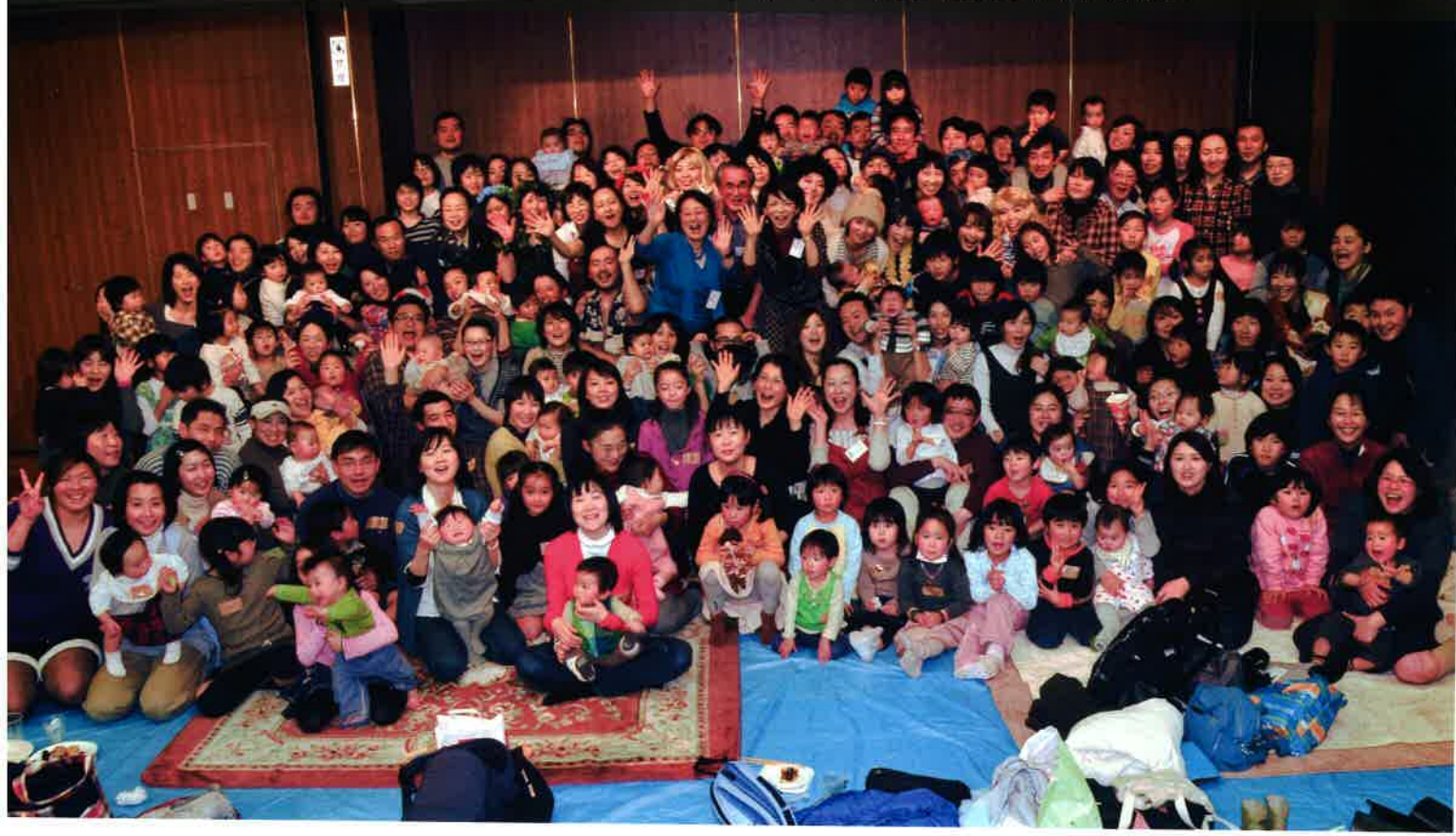
矢島助産院恒例の新春会の記念写真。助産院で産まれた子どもたちを連れて集まった親たち。同郷会さながらのにぎやかなイベントだ。一昨年、矢島助産院で出産した山梨県の助産師と産科医の夫も子どもを伴いかけた。(2009年2月、国分寺)

■ 医師と助産師の役割分担で機能する院内助産所やバースセンターの数少ない成功例が注目されているが、ならばそのシステムを全国に増やすのは国の仕事。産科と婦人科を分け、助産師たちが、産科医と対等の立場と自覚で女性を守る力を発揮できる体制作りこそが